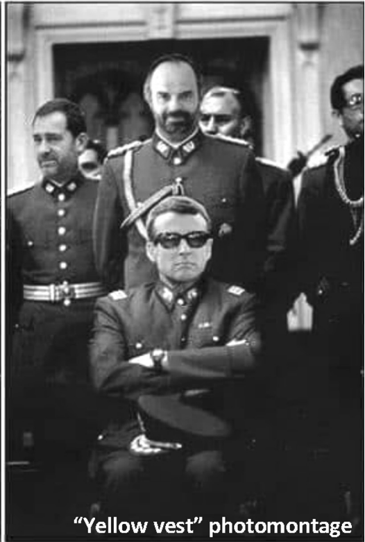
“Yellow vest” photomontage

Φωτομοντάζ από κόσμο που συμμετέχει στα Κίτρινα Γιλέκα. Αριστερά ο Πινοσέτ, δεξιά ο Μακρόν