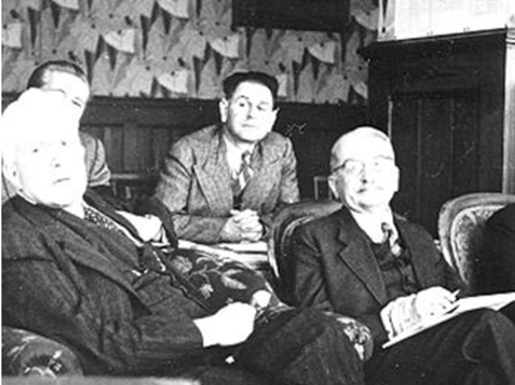
Ο Πόππερ και ο von Mises σε συνάντηση της πρώτης «νέο-» ή «όρντο-» φιλελεύθερης δεξαμενής σκέψης Mont Pelerin Society, της οποίας προέδρευε ο Χάγιεκ και αργότερα ο Rörke

πάρουν τον έλεγχο της δημοκρατίας, «αυτή πέφτει αναγκαστικά θύμα είτε της αναρχίας είτε του κολεκτιβισμού» (Rörke, 1942: 246). Σε κάθε περίπτωση, η πολιτικοποιημένη μαζική κοινωνία συνεπάγεται την «απώλεια της κοινωνικής ενσωμάτωσης», αμβλύνει τη «διαφοροποίηση της κοινωνικής θέσης» και οδηγεί στην ενίσχυση της «τυποποίησης και της ομοιομορφίας». Καταστρέφει, όπως ισχυρίζεται, την «κάθετη συνοχή της κοινωνίας» (Rörke, 1942: 246), οδηγώντας στην απώλεια της «ζωτικής ικανοποίησης» (Rörke, 1942: 240) και της αποδοχής της κοινωνικής θέσης. Μέσα από τη διαδικασία εκβιομηχάνισης και αστικοποίησης αναδύεται η φιγούρα του δυσαρεστημένου και ανήσυχου προλεταριάτου που, όπως η φιγούρα του νεκροθάφτη στον Μαρξ (Μαρξ και Ένγκελς, 2014), αποδυναμώνει