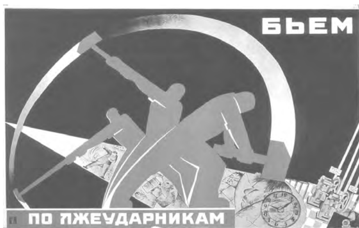
Σοβιετική αφίσα του 1931 με λεζάντα: Τσακίζουμε τους τεμπέληδες!

δεν γυρνά, εργάτη μπορείς χωρίς αφεντικά», όπως λέει το γνωστό σύνθημα.